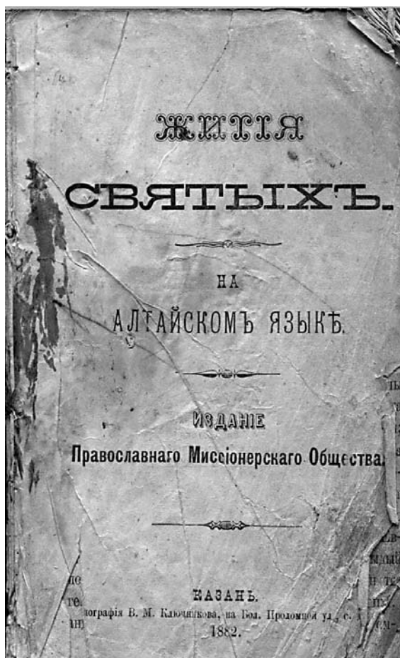
Один из трудов архиепископа Владимира – «Избранные жития святых на алтайском языке» – вышел в двух изданиях

Во время оглашения инородцы ходили в церковь и стояли там до литургии верных. При словах диакона «елицы оглашенные изыдите», они послушно выходили из храма.