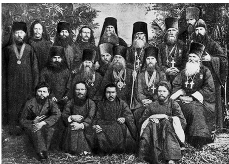
Алтайские миссионеры. В центре – епископ Владимир