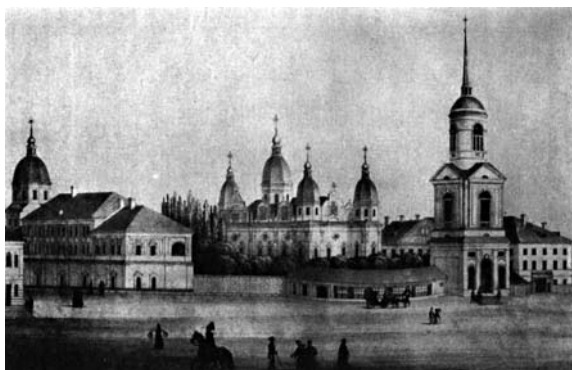
Киево-Братский монастырь и Академия. 1840-е гг.