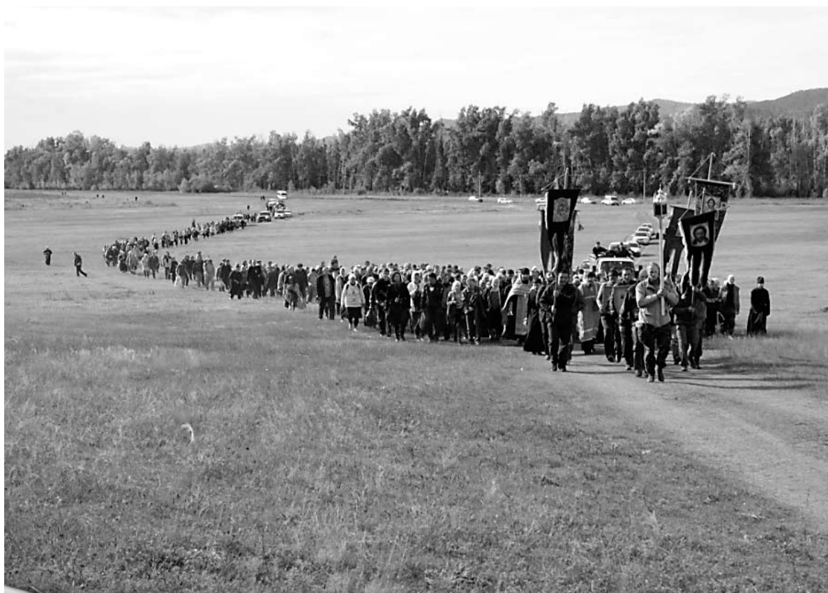
Крестный ход на Иоаннову гору в день Усекновения главы Пророка, Предтечи и Крестителя Господня Иоанна организует братия Свято-Троицкого Селенгинского монастыря